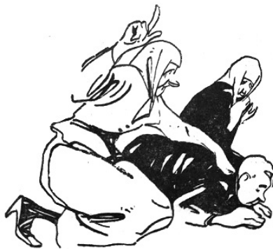
Рис. Г. Сундырева

Я знаю комсомольца, Который богу молится. Не по своей охоте, Он молится для тети.