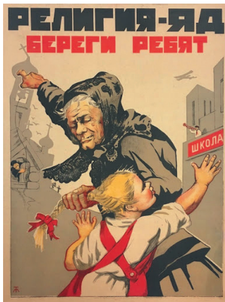
5. «Религия – яд, береги ребят!» Плакат Н. Терпсихорова. 1930 “Religion is a poison! Protect your children!” Poster by N. Terpsykhorov. 1930

Illustration for the article: Galina Egorova. Fear and Childhood Victimization in Atheistic Discourse during the Khrushchev Era