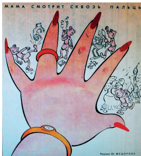
6. «Мама смотрит сквозь пальцы». Рис. Ю. Федорова. Крокодил. 1964. № 5 “Mother Turns a Blind Eye.” Ill. by Yu. Fedorov. Krokodil. 1964. No. 5