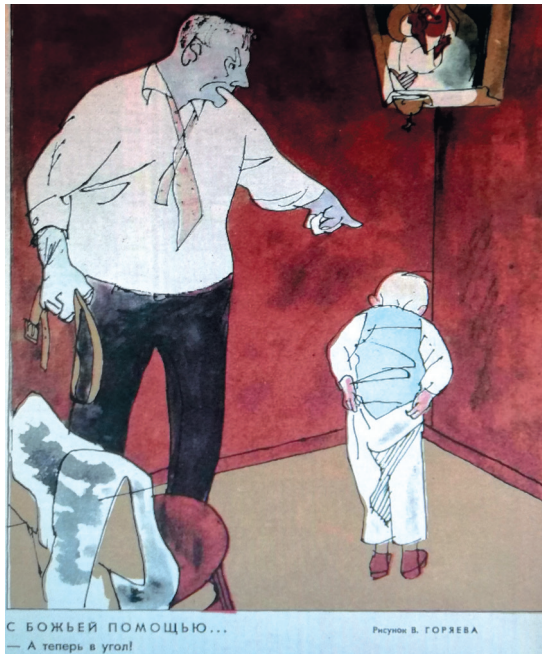
7. «С Божьей помощью». Рис. В. Горяева. Крокодил. 1964. № 8 “With God’s Help.” Ill. by V. Goryaev. Krokodil. 1964. No. 8